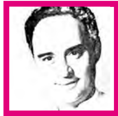
Soy Ferran Adrià y propongo para el 2030...

AHORA PUEDES CREAR UNA AGENDA LLENA DE VALORES