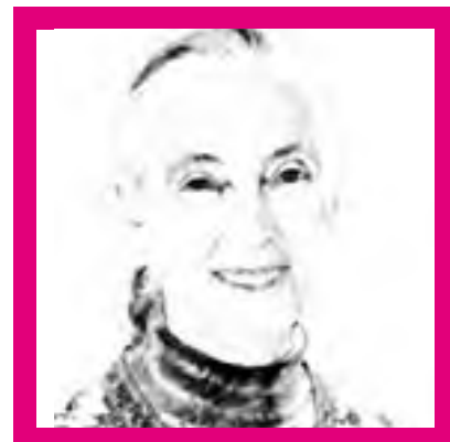
Soy Jane Goodall . Mi reto para el 2030 es...