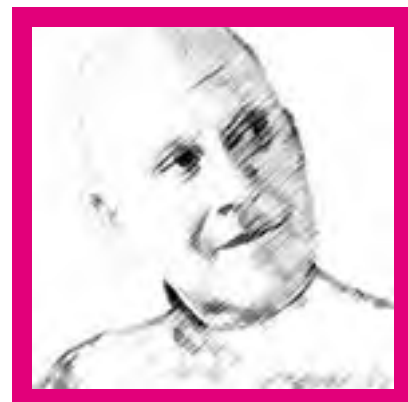
Soy Norman Foster y mi reto es...